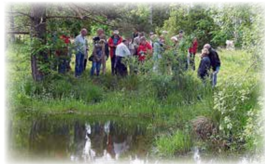
Blomstervandring i Dammahagen.

I Länsstyrelsen inventering av ängs- och hagmarker uppmärksammades särskilt Dammahagen för sina höga naturvärden. Genom kontinuerligt bete och genom att inte tillföra konstgödsel har den äldre floran till stor del bevarats. Uppe bland enarna kan du se torrbacksväxter som back-