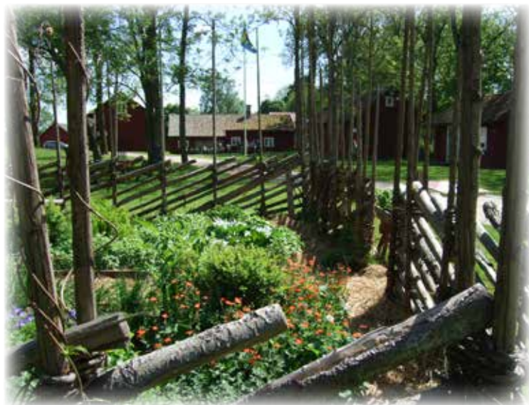
Persgårdens örtagård i förgrunden

I Karleby användes ”rishumlegårdar”, där humlens rötter täcktes av ett tjockt lager med ris för att hålla odlingen fri från ogräs.