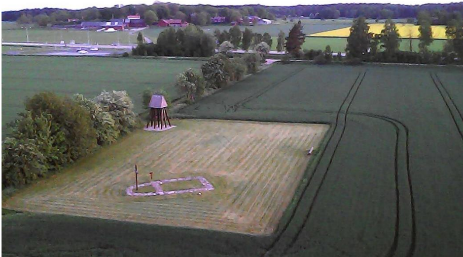
Kapellgården nordost om Karleby, nära ån Tidån.